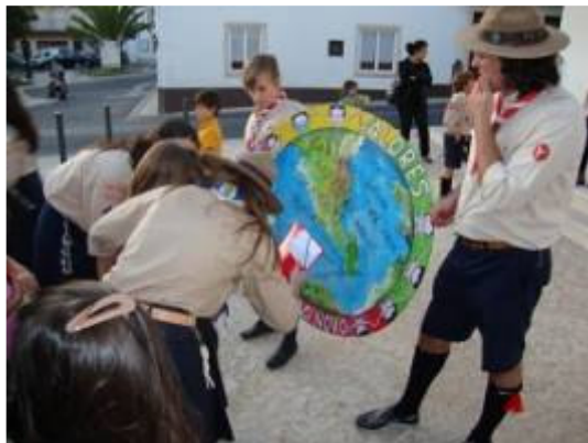
Uma canhota de todos os Escuteiros do 1097

intervenção divina do nosso Chefe Máximo, voltámos já ao ritmo habitual do Agrupamento. Os Lobitos já acantonaram, os Exploradores e Pioneiros já se “perderam” por Óbidos, realizámos Promessas e uma Festa de Reis verdadeiramente “real”; com a presença dos Reis Magos, em viagens cheias de peripécias devido a GPS’s avariados, em carros que furaram no percurso e outras avarias que até o “Bob – o construtor” veio tentar reparar. Agora é deixar correr o calendário e viver o mais intensamente possível todas as aventuras previstas de Agrupamento e de Núcleo.