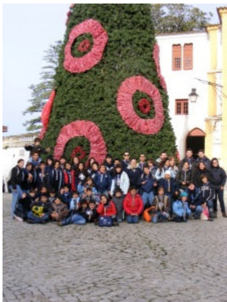
“A estrela de Brownsea

No fim-de-semana de 11 a 13 de Dezembro realizou-se a actividade de Natal do nosso Agrupamento. Este ano o local escolhido foi a bela Vila de Sintra e ficámos alojados no Centro Paroquial da Freguesia de S. Miguel. No seguimento do tema escolhido para este ano escutista, “Simplesmente Escutismo”, a actividade teve por base o seguinte tema “A Estrela de Brownsea”, do qual vos deixamos aqui o imaginário: